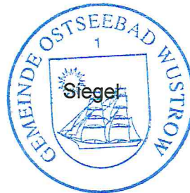
Olaf Müller Bürgermeister